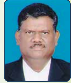
Adv. Baby George