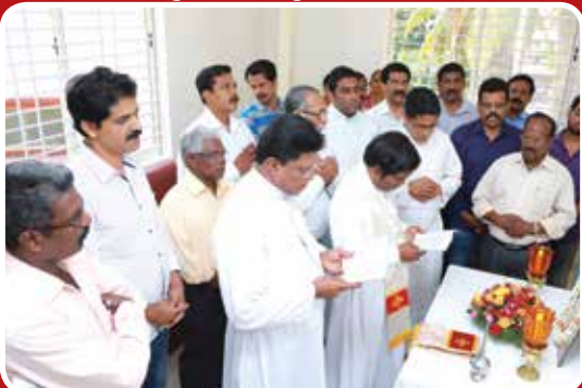
Blessing of the new school bus of Christ nagar School by Fr. Rector